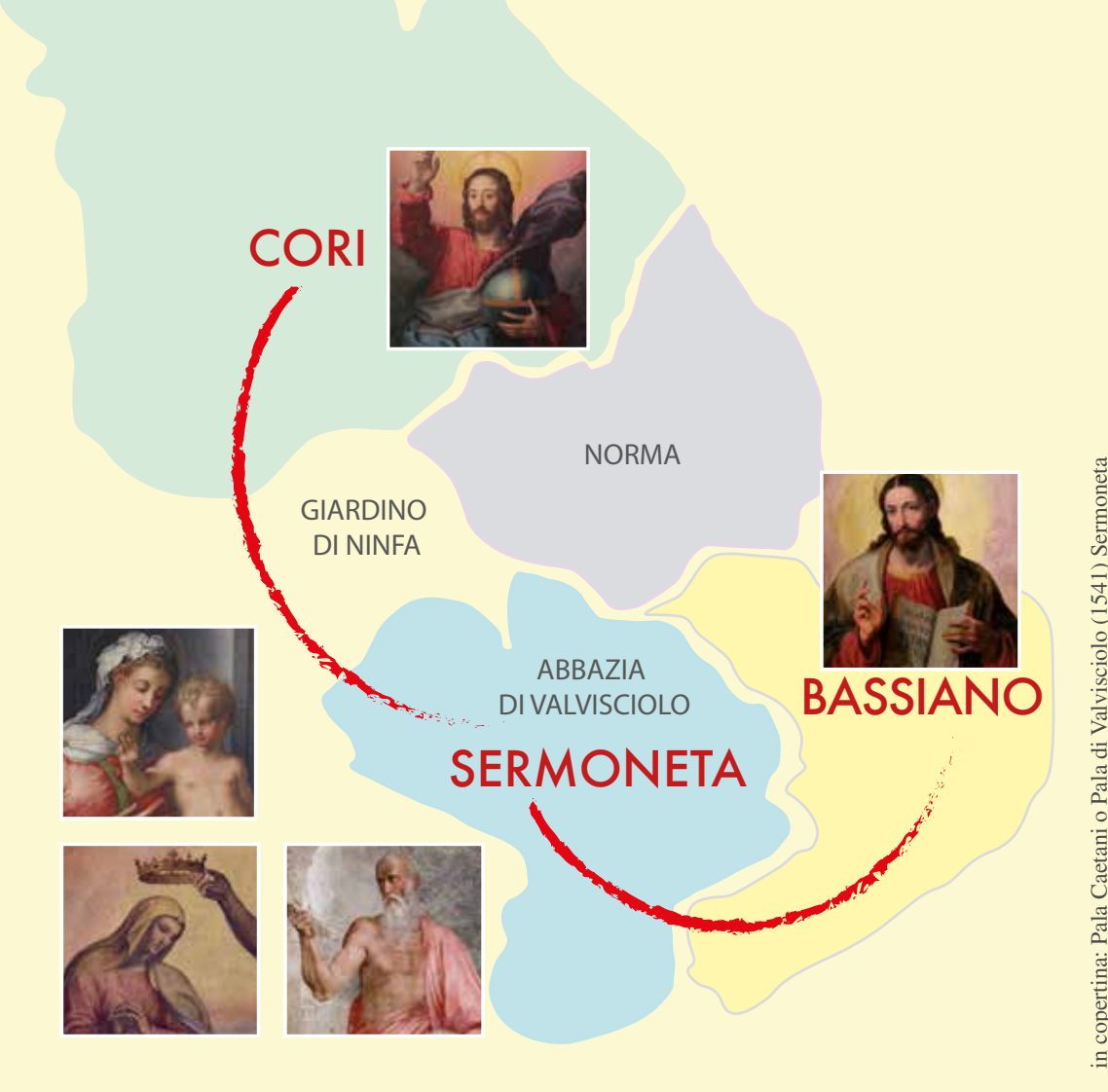
in copertina: Pala Caetani o Pala di Valvisciolo (1541) Sermoneta