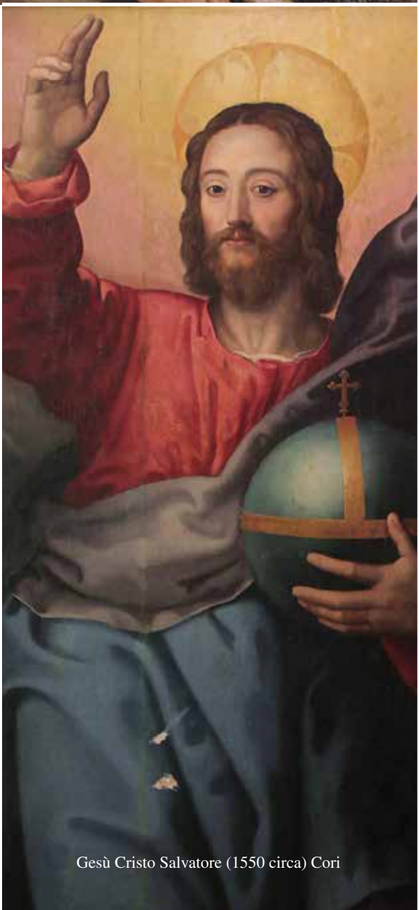
Gesù Cristo Salvatore (1550 circa) Cori