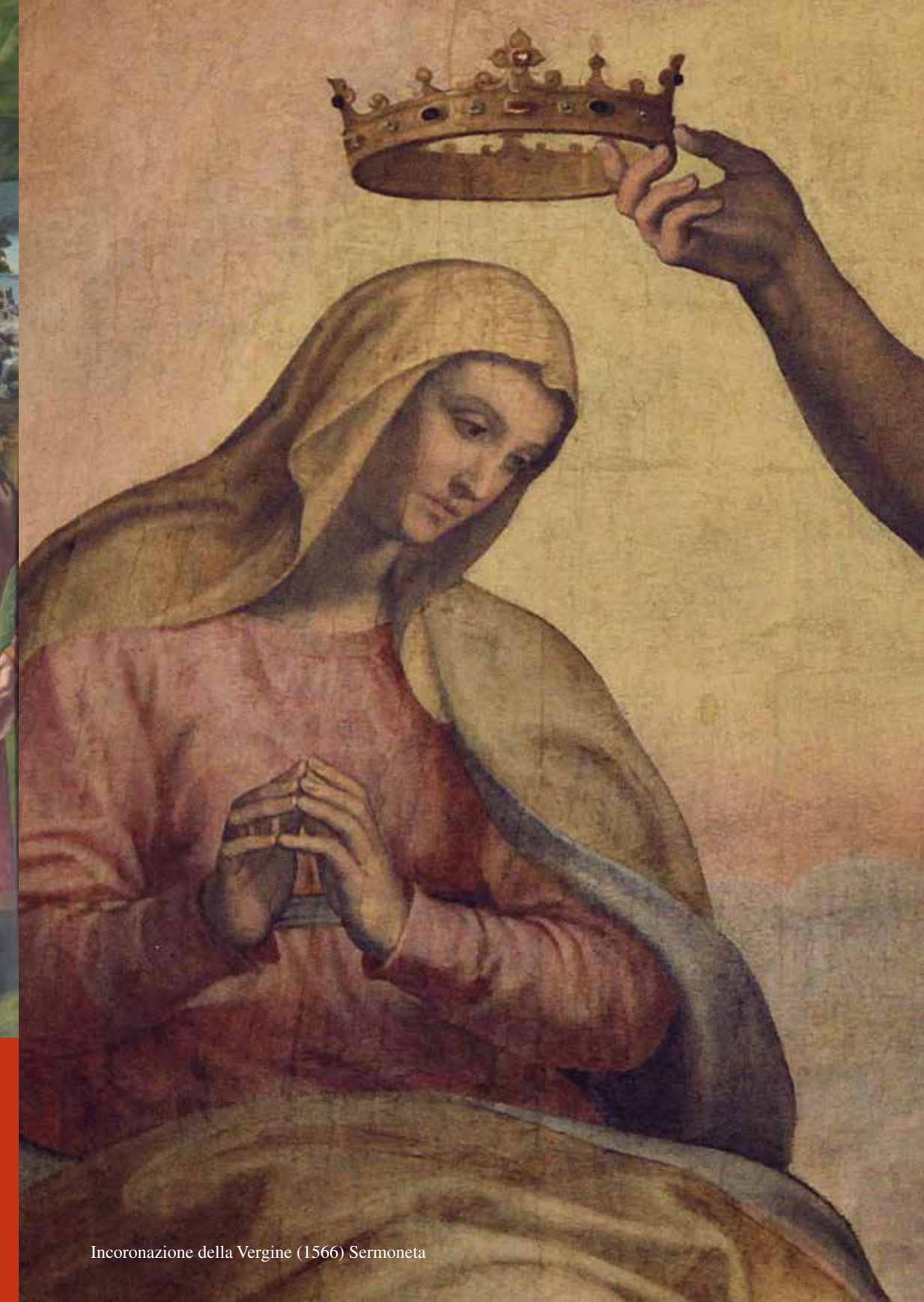
Incoronazione della Vergine (1566) Sermoneta