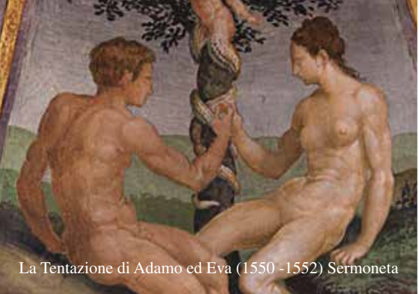
La Tentazione di Adamo ed Eva (1550-1552) Sermoneta