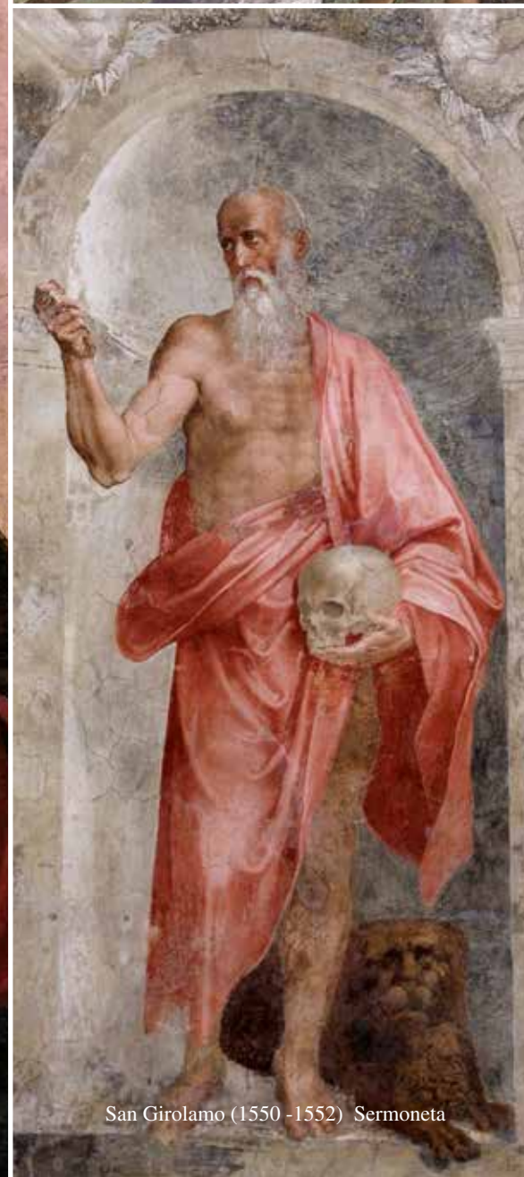
San Girolamo (1550-1552) Sermoneta