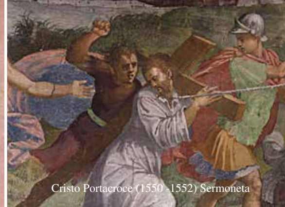
Cristo Portacroce (1550-1552) Sermoneta